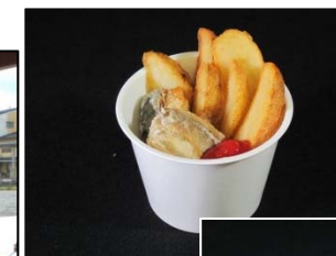
← 鯖and ポテト