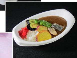
↑ 駅長特製！ 鯖カレー