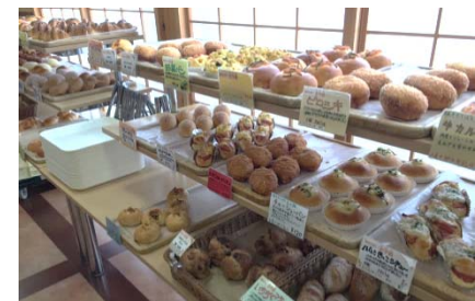
焼きたてパンも人気。