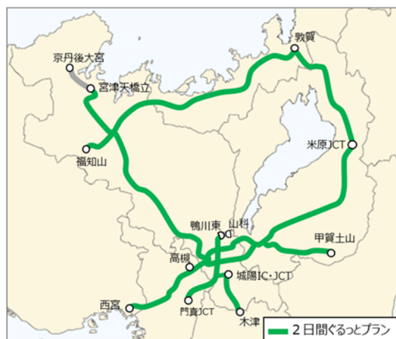
2 日間ぐるっとプラン