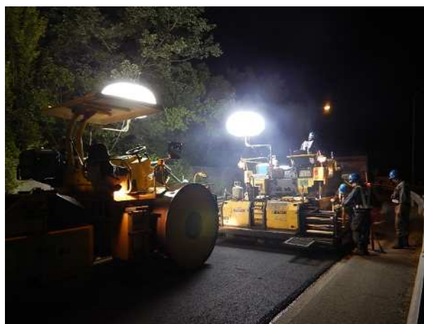
《舗装補修施工状況(イメージ写真)》