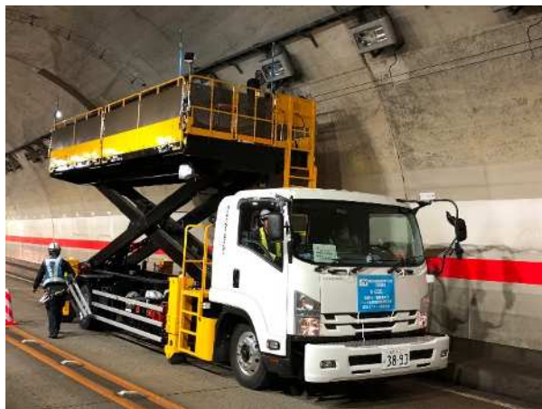
《設備清掃・点検(イメージ写真)》

消火設備、ジェットファン、照明設備などのトンネル附属物、排水構造物などの道路附属物を常時良好な状態に保つための点検・清掃をおこないます。