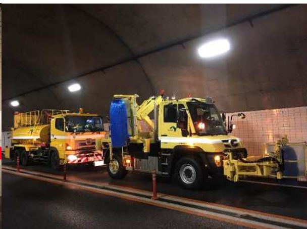
《トンネル側壁清掃(イメージ写真)》