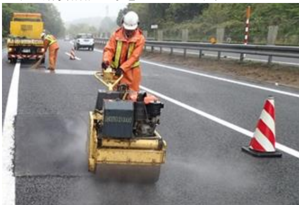
《路面損傷箇所の補修》

走行安全性・快適性の確保のため、舗装面のひび割れや段差などが顕著に発生している箇所を修復する舗装補修工事をおこないます。