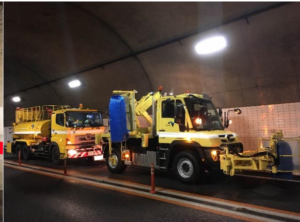
《トンネル側壁清掃》