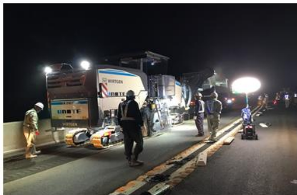
《傷んだ舗装撤去状況》

橋梁の床版※に雨水などが浸透すると床版の耐荷力や耐久性に悪影響を及ぼすため、浸透しないよう防水層を設けています。舗装損傷（ポットホールなど）に伴い防水層も損傷しているため、損傷した防水層の再施工をおこないます。