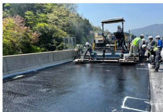
《床版防水工施工状況》