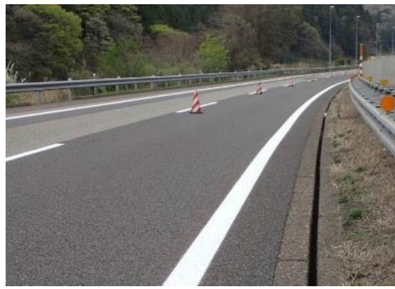
《路面標示工の施工》