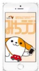
画面イメージ (アプリ起動時)

※NEXCO 中日本管内(新名神 甲賀土山 IC 以东)のみご利用いただけます。