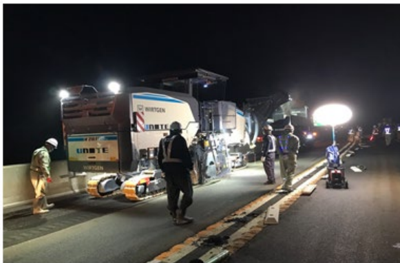
《傷んだ舗装撤去状況》

橋梁の床版※に雨水などが浸透すると床版の耐荷力や耐久性に悪影響を及ぼすため、浸透しないよう防水層を設けています。舗装損傷（ポットホールなど）に伴い防水層も損傷しているため、損傷した防水層の再施工をおこないます。