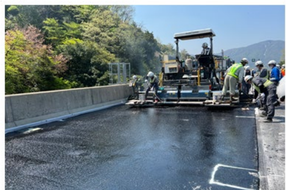
《床版防水工施工状況》