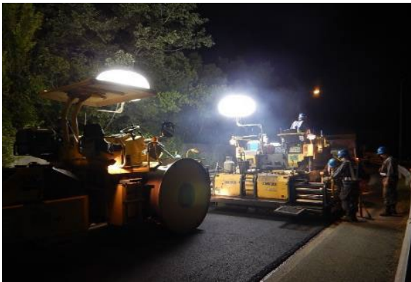
《路面損傷箇所の補修》

走行安全性・快適性の確保のため、舗装面のひび割れや段差などが顕著に発生している箇所を修復する舗装補修工事をおこないます。