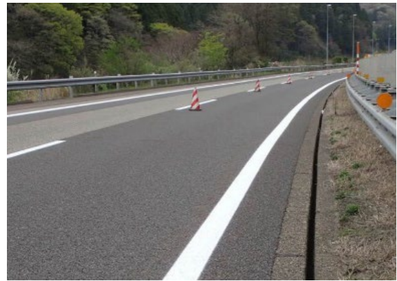
《路面標示工の施工》