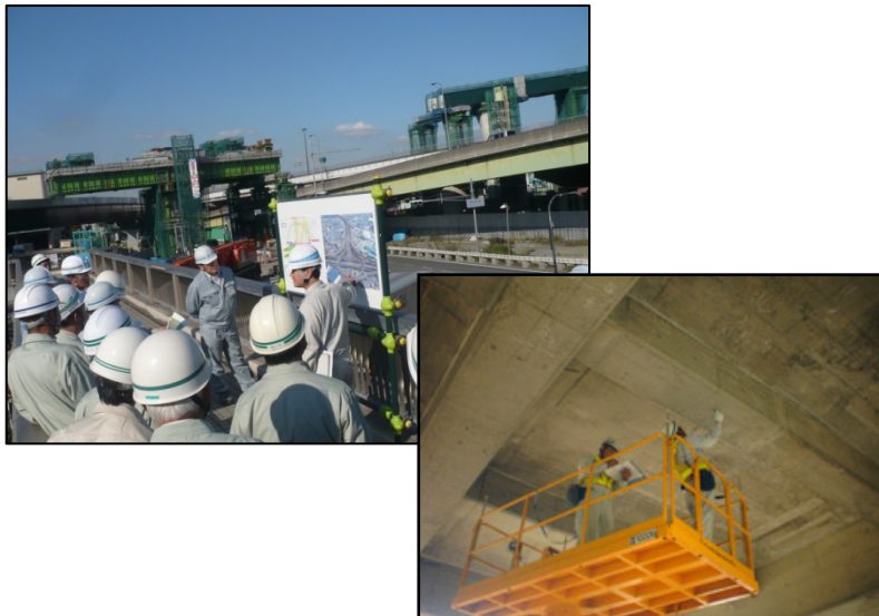
【現場講習会や技術交流】