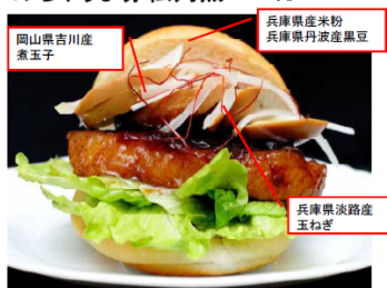
グランプリ商品 中国道: 赤松PA Ⓔ