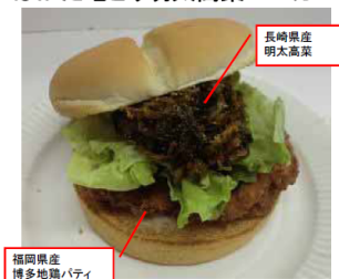
北部九州代表商品 九州道: 基山PA Ⓔ Ⓕ