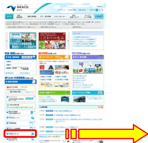
NEXCO西日本ホームページよりアクセス

混雑しているSA等の手前や先のPAが混雑していない場合があります ので、ぜひご利用ください。特に、 お食事の時間などはSA・PAの駐車場は大変混雑することが予想されます ので、この地図を参考にいただき、 少しでも混み具合の低いSA・PAをご利用になれるか、ご利用時間帯をずらす など、ひと工夫加えられることをおすすめします。