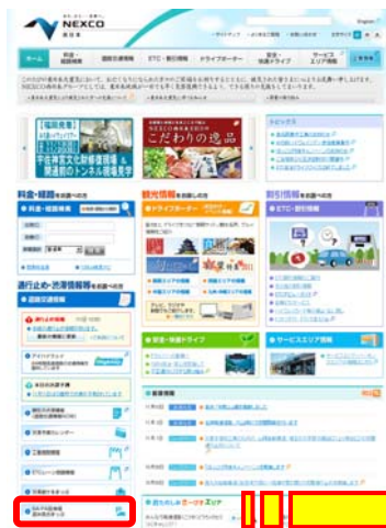
NEXCO西日本ホームページよりアクセス

混雑しているSA等の手前や先のPAが混雑していない場合があります ので、ぜひご利用ください。特に、 お食事の時間などはSA・PAの駐車場は大変混雑することが予想されます ので、この地図を参考にいただき、 少しでも混み具合の低いSA・PAをご利用になれるか、ご利用時間帯をずらす など、ひと工夫加えられることをおすすめします。