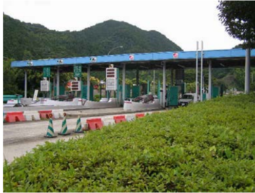
写真-1 篠栗料金所施設

無料開放後に篠栗料金所施設等の撤去を概ね平成 27 年 2 月頃まで実施します。工事期間中は車線の切り替えなどが発生します。