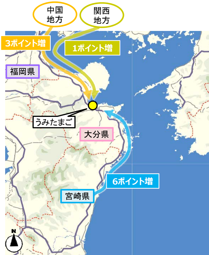
※数値は東九州道開通後（H27.5.3）の地域別増加割合