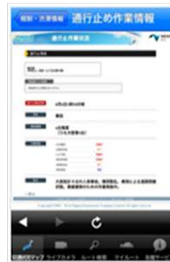
通行止め作業状況