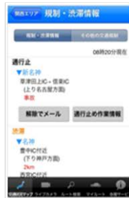
通行止め解除通知