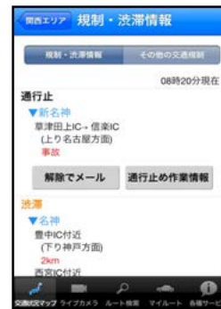
通行止め解除通知