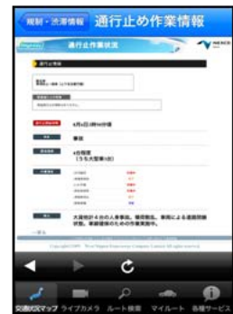
通行止め作業状況