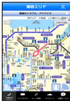
交通状況・マップ