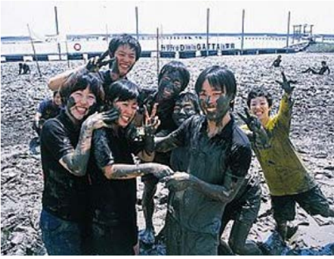
▲有明海(干潟体験場)