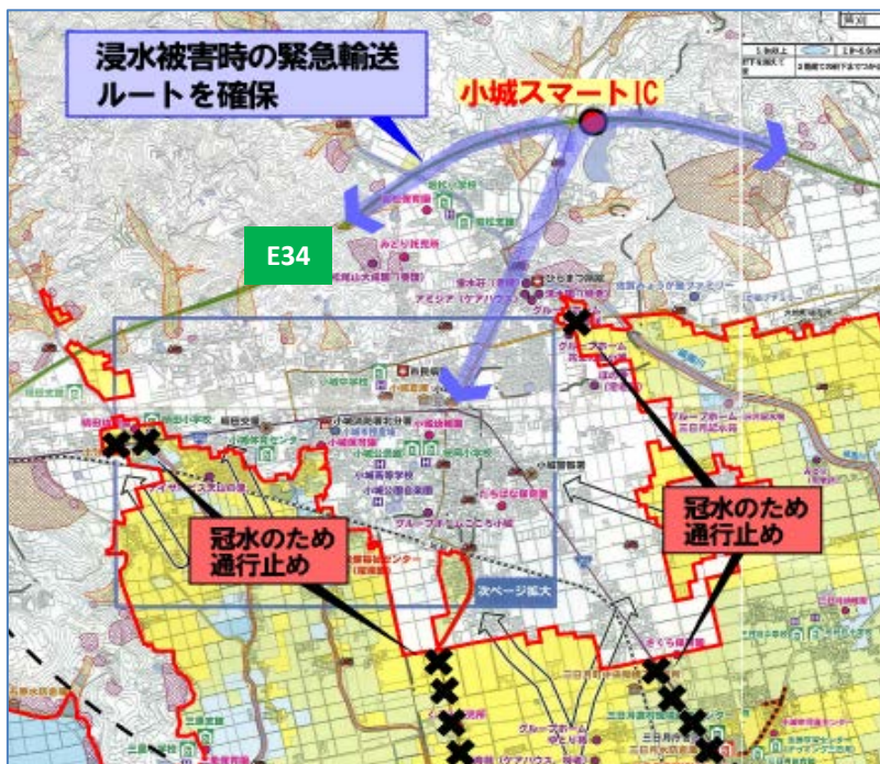
▲ 浸水被害時の緊急輸送ルート 資料: 小城市洪水ハザードマップ