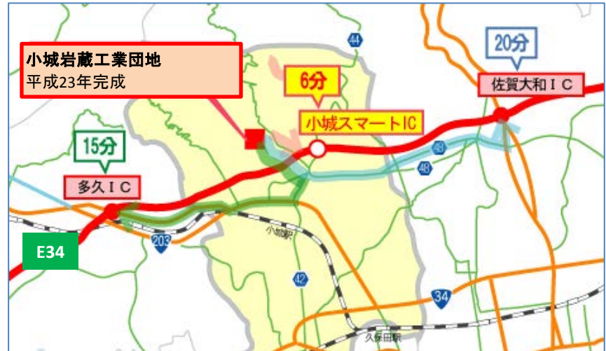
▲小城スマートIC整備に伴う 小城岩蔵工業団地の高速ICアクセス性の変化