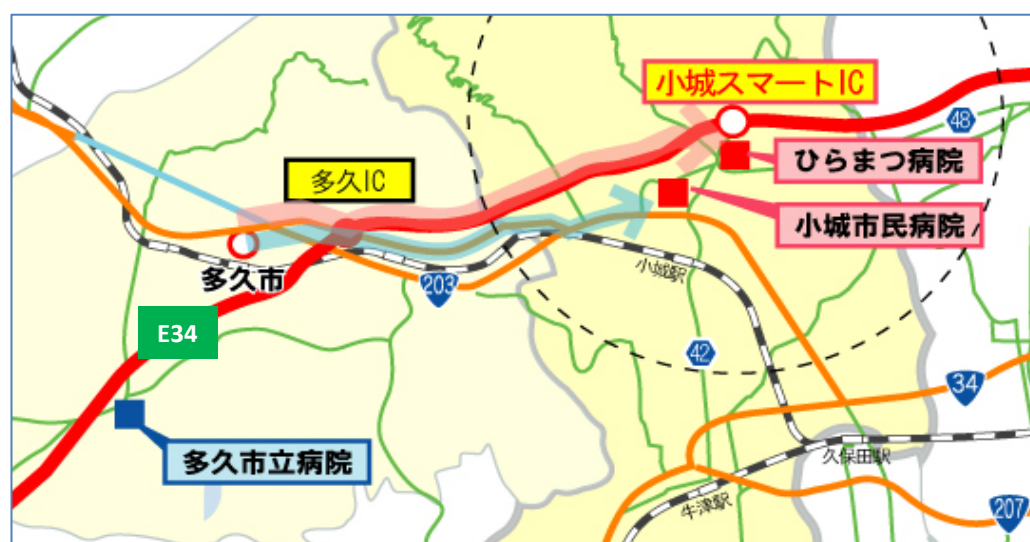
▲ 小城スマートIC整備に伴う多久市方面から小城市への救急搬送ルートの変化予想