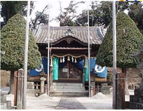
▲牛尾神社及び周辺の牛尾梅林