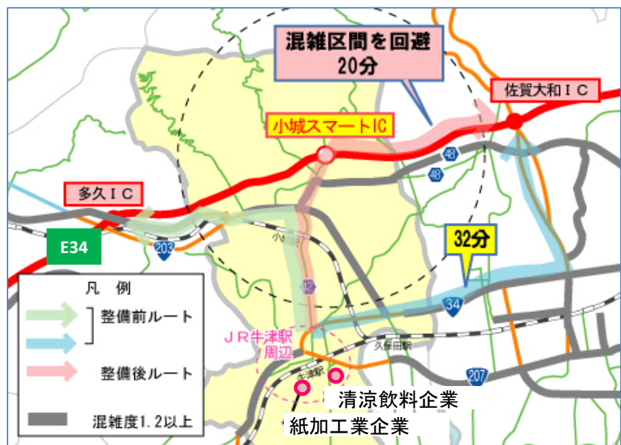
▲小城スマートIC整備に伴う物流効率化の支援 (JR牛津駅周辺～佐賀大和IC間)