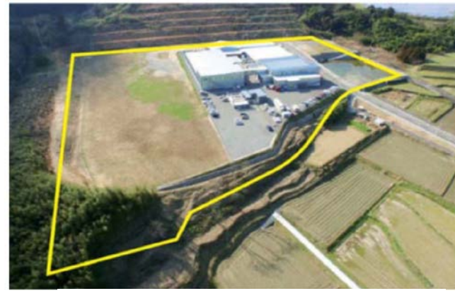
▲ 小城岩蔵工業団地 (区画面積：約25,000m 2 )