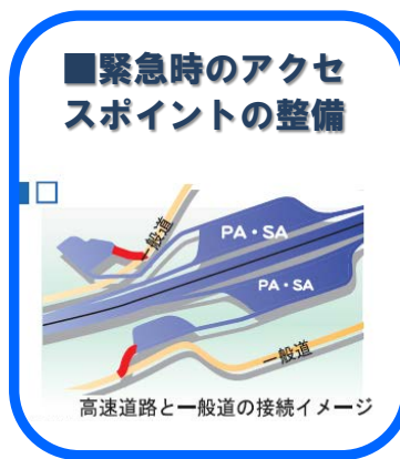
■ 緊急時のアクセスポイントの整備