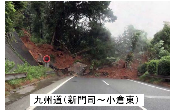
九州道(新門司～小倉東)