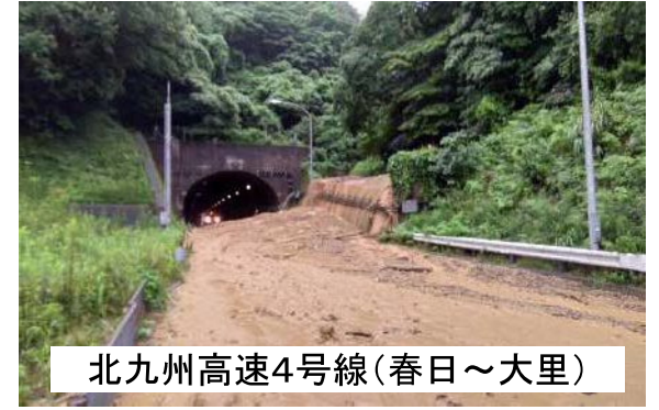
北九州高速4号線(春日～大里)