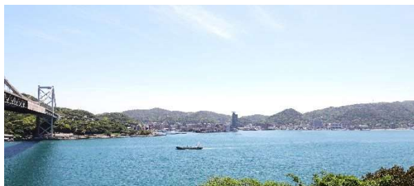
壇之浦PAから関門海峡を望む圧巻のロケーション