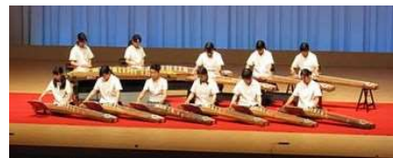
下関短期大学付属高校 箏曲部

全国高等学校総合文化祭日本音楽部門で出場経験のある 下関短期大学付属高校 箏曲部の皆様をお招きして、 ご来店されたお客さまを「琴の音色」でお出迎えます。