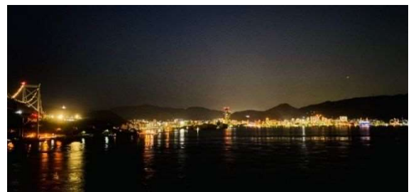
壇之浦PAから望む門司港レトロ帯のロマンチックな夜景