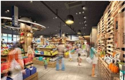
(画像はイメージです)