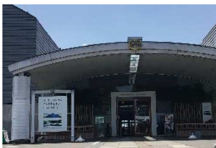
① 霧島ファクトリーガーデン