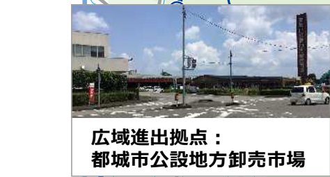
広域進出拠点： 都城市公設地方卸売市場