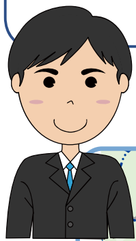
高原町 総合政策課

広域的な災害が発生した場合、 山間にある本町にとっては一般 道が崩土、橋梁の落下等により 通行止めとなる可能性がある ため、災害時の宮崎自動車道 の開放に期待しています。