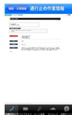
通行止め作業情報