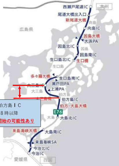
E 7 6 西瀬戸自動車道