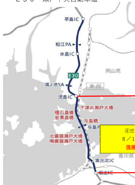
E 3 0 瀬戸中央自動車道