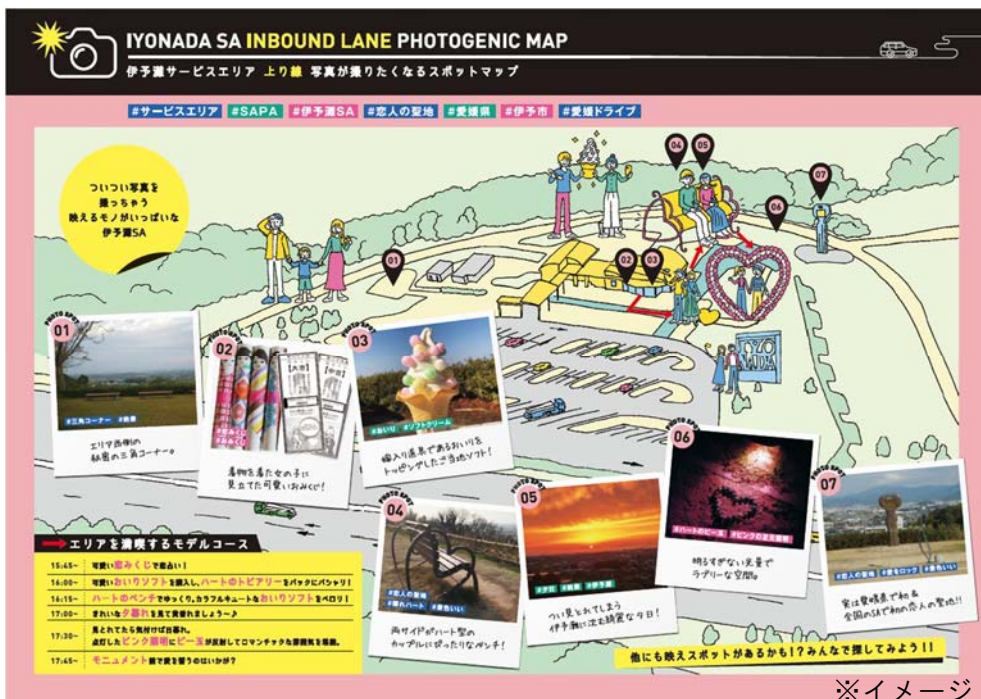
伊予灘 SA 上り線

※エリアのPR ツールとして、SNS 受けが期待できるエリア内の映えスポットを紹介するマップを作成