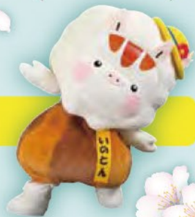
東温市 イメージキャラクター いのとん