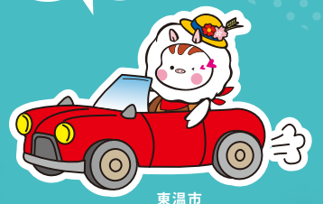
東温市 イメージキャラクター いのとん