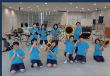
東みよし町立 三加茂中学校吹奏楽部