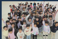
東みよし町立 みかも保育所