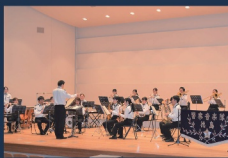
徳島県警察音楽隊