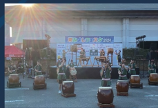
東みよし町立 三加茂中学校青年太鼓