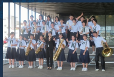
東みよし町立 三好中学校吹奏楽部