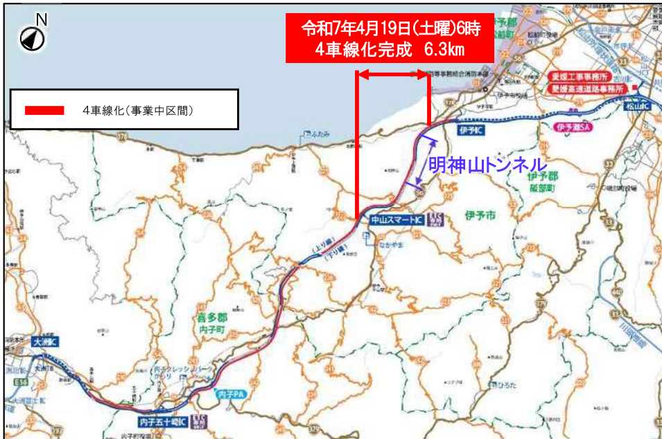
明神山トンネル付近の渋滞状況