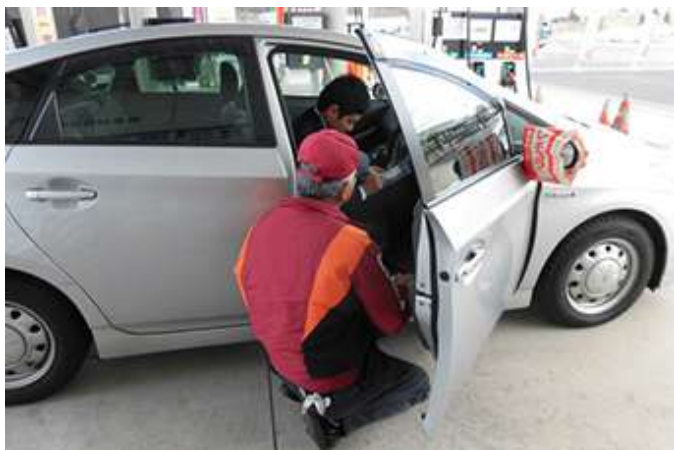
誤給油防止訓練の様子