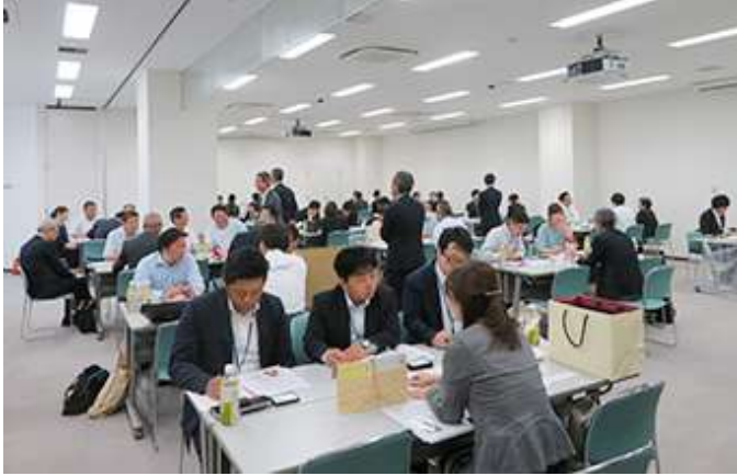
南九州ハイウェイ大商談会の様子