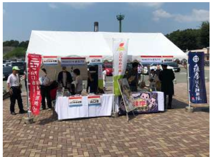
明治維新150年物産展の様子 九州自動車道 広川SA下り線