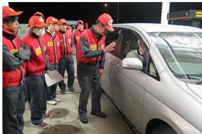
誤給油防止訓練の様子