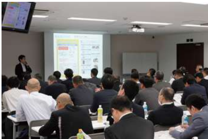
アレルギー講習会の様子

お客さまに安心してSA・PAを利用していただけるよう、今後も継続して講習会等を実施する予定です。