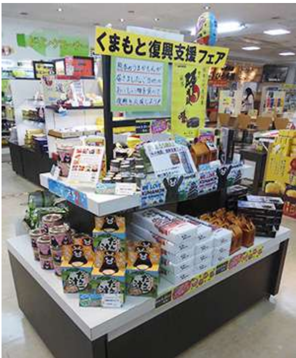
熊本物産展の様子 高松自動車道 豊浜SA上り線

今後も各テナント会社や地元の商工会等と協働しながら継続開催することで、より多くのお客さまに地域の魅力を発信していきます。