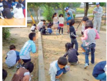
地元小学生と一緒にどんぐり拾い