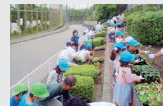
花植えを楽しむ子どもたち

高速道路の沿道地域との共生を図るため、NEXCO西日本ではさまざまな交流イベントを行っています。中国自動車道では、宝塚市立安倉北小学校の児童と一緒に、小学校前ののり面花壇で「花植え会」を毎年2回(6月頃:2年生、12月頃:3年生)実施しています。「花植え会」は2011年で22年目を迎え、約20年前に児童として参加した方も子どもたちが参加するなど、2世代にわたった行事として地域で親しまれています。