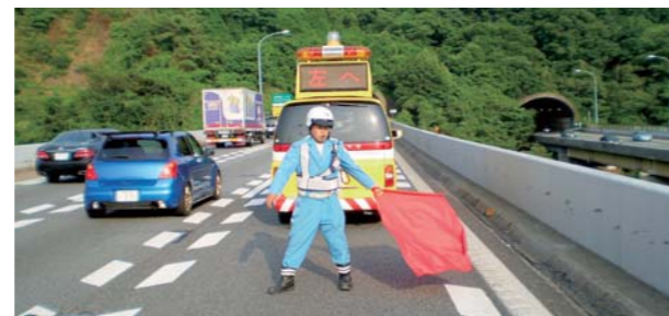
安全を最優先に現場で対応する交通管理隊員

また、2010年7月、大阪、兵庫、京都、滋賀の各県警と連携した「高速道路重大事故根絶プロジェクト」に参加し、渋滞時の重大事故根絶に向けた対策を継続的に議論しています。ETC休日特別割引の実施で、これまであまり高速道路を利用いただいたことがなかったドライバーも増えていきますので、安全確保に向けたより一層の努力が必要だと考えています。