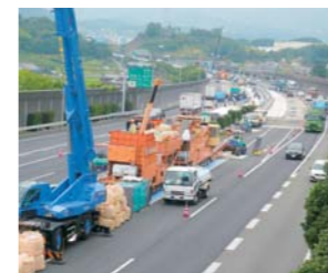
中国自動車道での集中工事規制

経年劣化や交通荷重による橋梁劣化が進んでおり、路面には床版劣化に伴うポットホール(路面損傷)が頻発しています。そこで、補修に伴う緊急工事規制の回数を減らすため、ポットホール発生件数の多い橋梁から順に集中工事規制による補修工事を実施しています。2007年度から床版上面増厚工事(床版防水工含む)や舗装補修工事、中分防護柵老朽化更新工事などを行っており、2010年度は、中国自動車道 西宮山口ジャンクション～神戸ジャンクション間の2橋について、約8,300㎡の床版上面増厚工事を行いました。