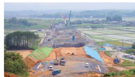
工事が着々と進む盛土区間