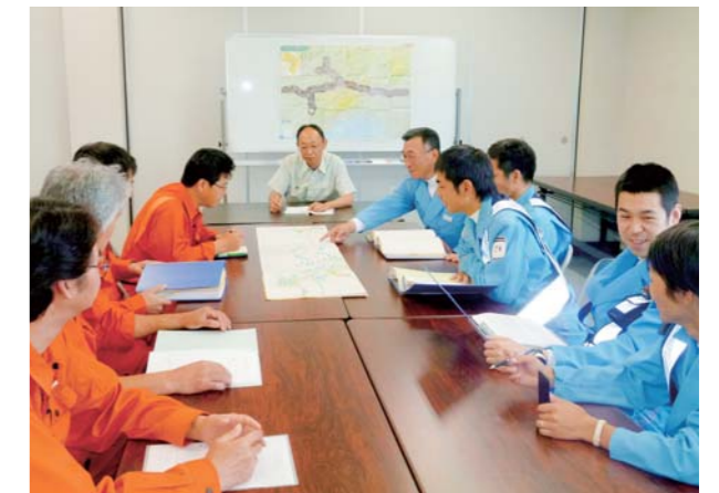
グループ会社との全体会議

道路ネットワークを支えるのは、グループの人的ネットワークですから、お客さまの快適な走行を確保するため、グループ会社との連携協力には特に力を入れています。現地巡回を行う交通管理隊や道路のメンテナンス部門はもちろん、料金所やエンジニアリング部門との綿密なコミュニケーションは不可欠です。定期的に勉強会も開催して現場での対応を議論するなど「100%の安全・安心」の達成にグループ社員一丸となって取り組んでいます。