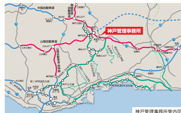
神戸管理事務所管内図

2010年は、ETC休日特別割引や舞鶴若狭自動車道の無料化社会実験の影響もあり、管内全体で交通量が増加傾向となっています。阪神高速道路や神戸淡路鳴門自動車道など隣接する区間との連携も密にして、交通安全・渋滞対策などお客さまの安全・安心の確保に全力で取り組んでいます。