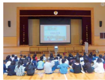
出張学習会で高機能舗装の仕組みを説明

また、福岡工事事務所独自の取り組みとして、地元小学生と一緒に沿道の緑樹帯にどんぐりの木を植える予定です。拾ったどんぐりを苗木になるまで育成し、開通前に植樹します。