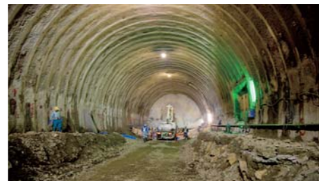
騒音・振動に細心の注意を払いながら掘削を実施

盛土工事は2011年後半から始める予定ですが、その際は10tのダンプカーが市街地の生活道路を走るようになりますので、粉じん対策や交通安全対策に万全を期し、ダンプカーの速度超過や過積載が無いようドライバーへの指導も徹底するよう社員に呼びかけています。