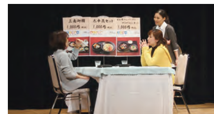
接客コンテストの様子

2014年度も接客コンテストを継続して実施するとともに、今後も、テナント会社と協働で、お客さま満足度を高めるために取り組んでいます。