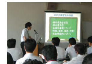
衛生講習会の様子

そのため、SA・PA各店舗の従業員の食品衛生に関する知識と意識の向上を目的とした食品衛生講習会を、年1回実施しています。2013年度は、テナント会社(全59社)に参加いただきました。