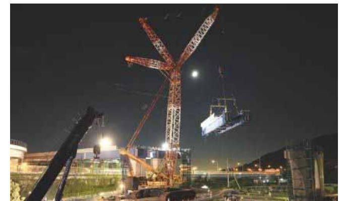
写真:H23年9月 大山崎JCT 工事状況(提供:小野耕司朗氏)