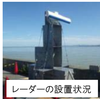
レーダーの設置状況