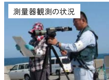
測量器観測の状況