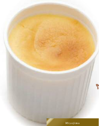
Miyajima An to Cheese Cheese Cakes with cream ミヤジマアントチーズ