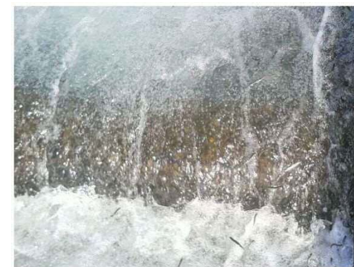
第十堰での遡上の様子

調査の結果、稚アユの遡上が初めて確認されたのは平成29年3月20日で、最後に確認されたのは平成29年5月26日であった。防止膜の有無に関係なく、稚アユの遡上確認された。