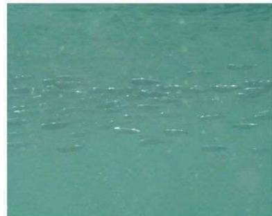
確認魚群の状況（ボラ）