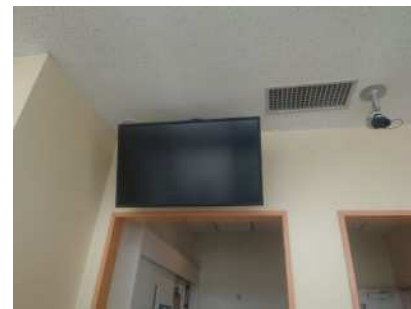
②利用状況モニター