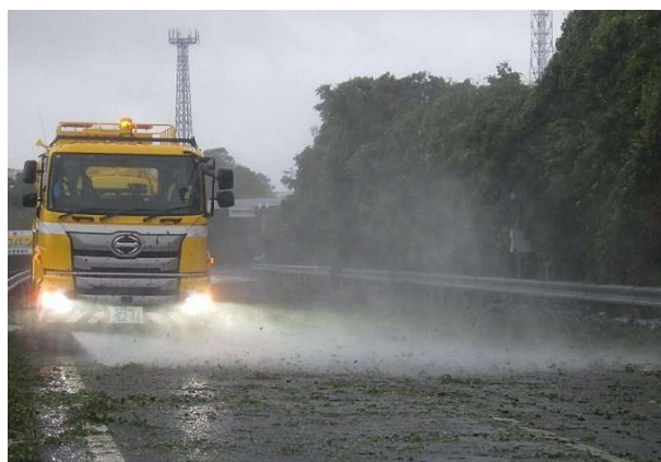
(路面清掃作業の状況)