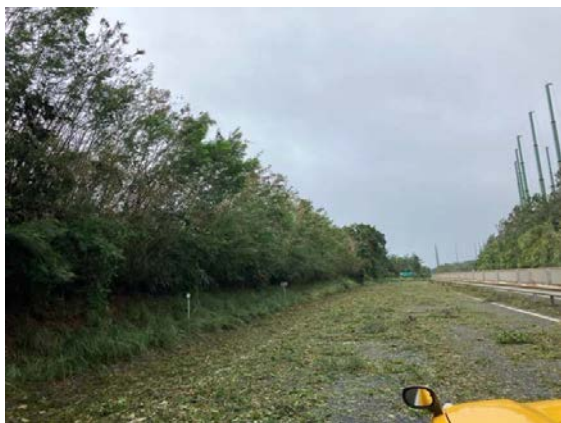
(枝葉が路面に散乱)

現在、倒木等により枝葉が路面に多数散乱しているため、清掃作業を実施しております。早期の通行確保に向けて全力を尽くしてまいります。