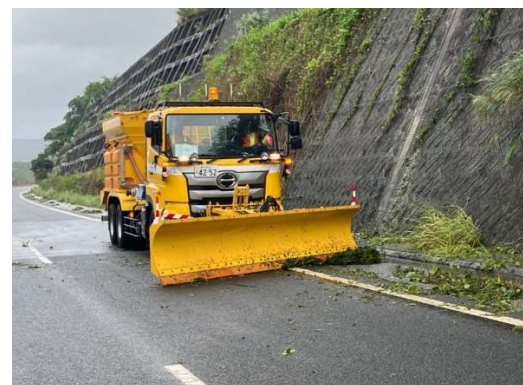
(路面清掃作業の状況)