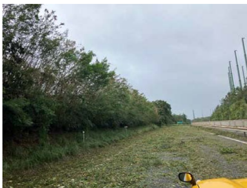
(枝葉が路面に散乱)

現在、倒木等により枝葉が路面に多数散乱しているため、清掃作業を実施しております。早期の通行確保に向けて全力を尽くしてまいります。