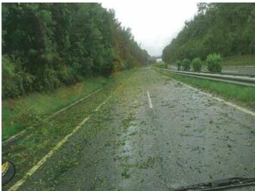
(枝葉が路面に散乱)

現在、倒木等により枝葉が路面に多数散乱しているため、清掃作業を実施しております。早期の通行確保に向けて全力を尽くしてまいります。