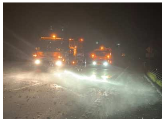
(路面清掃作業の状況)