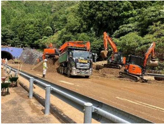
坊口トンネル東坑口復旧作業状況