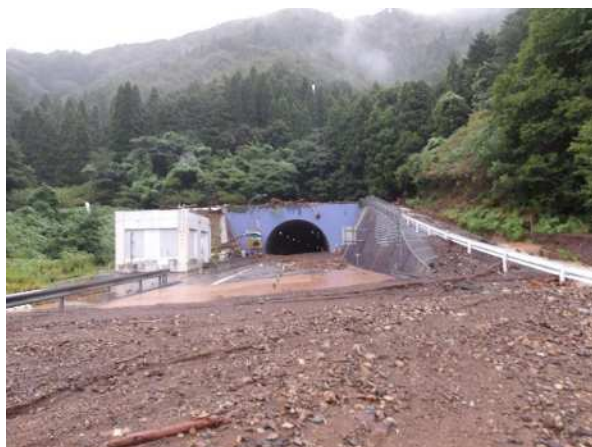
坊口トンネル東坑口 (亀岡方面から宮津方面を望む)