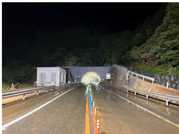
坊口トンネル東坑口復旧完了