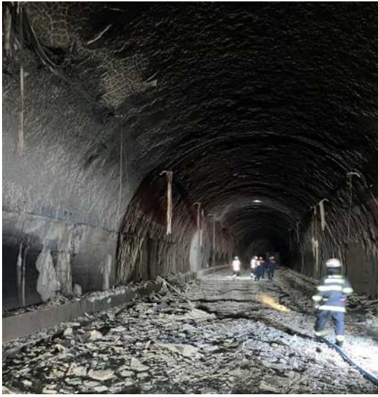
トンネル内部の焼損状況 コンクリート表面の剥離