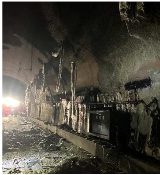
トンネル内道路施設の焼損状況 道路照明等の焼損