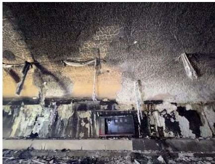
火災後のコンクリート表面