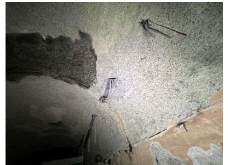
トンネル側面の剥離