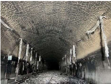
トンネル内部(全景)