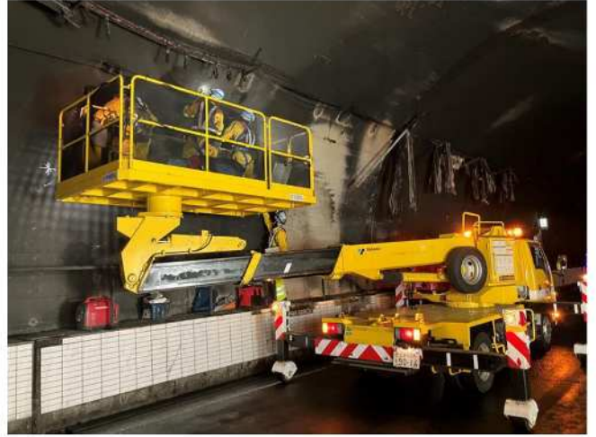
(トンネル覆工点検・復旧作業 18時50分時点)