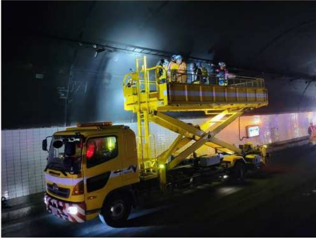
(トンネル照明設備点検・復旧作業 20時50分時点)

現在、火災により損傷したトンネル照明等の設備およびトンネル覆工の点検・復旧作業を実施しております。 早期の通行確保に向けて全力を尽くしてまいります。