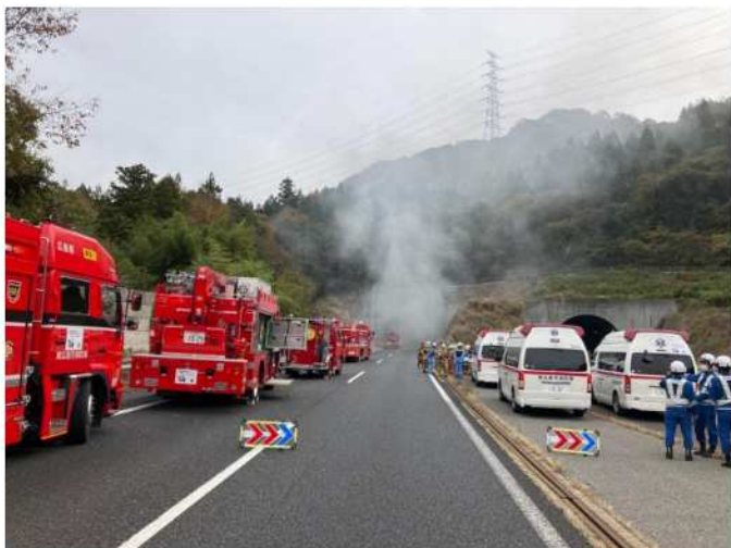
(11/16 11:17 撮影)