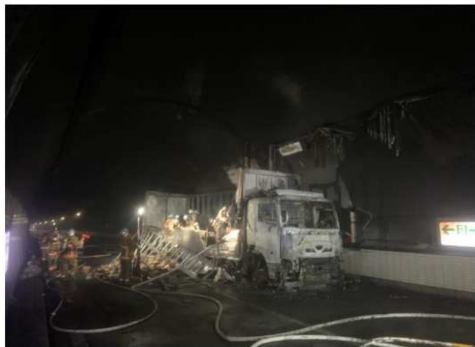
(11/16 14:20 撮影)