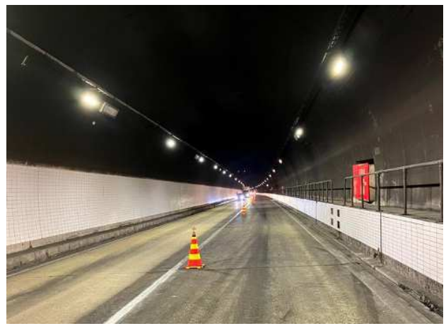
(復旧後 17日 10時50分時点)