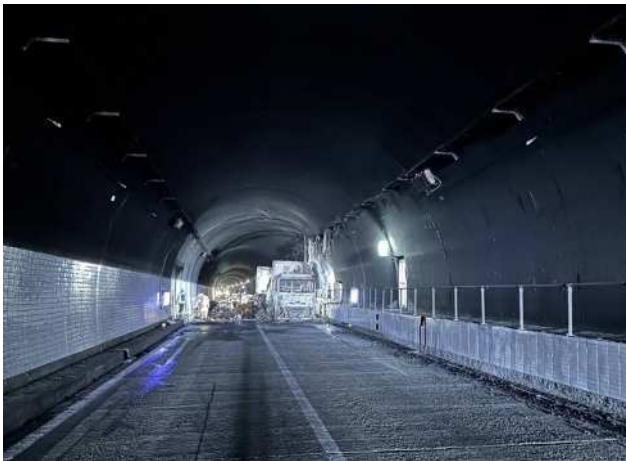
(トンネル照明設備被災状況 16日 14時40分時点)