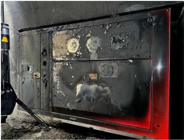
(消火栓設備被災状況 16日 14時40分時点)