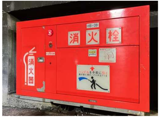
(復旧後 17日 10時50分時点)