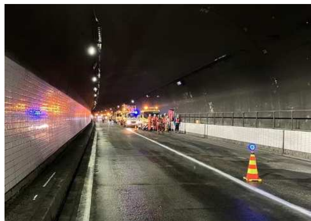
(追越車線側トンネル照明等設備復旧状況)