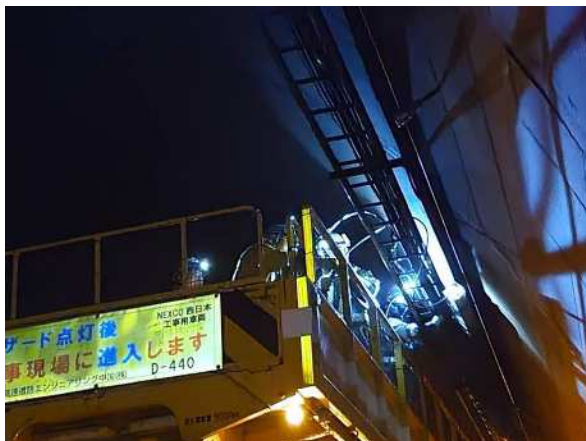
(トンネル照明設備復旧作業)