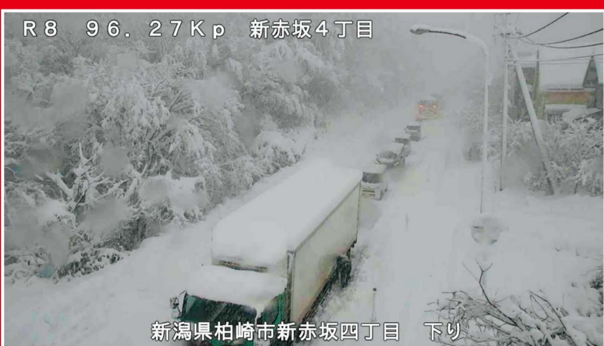
R8 96.27Kp 新赤坂4丁目