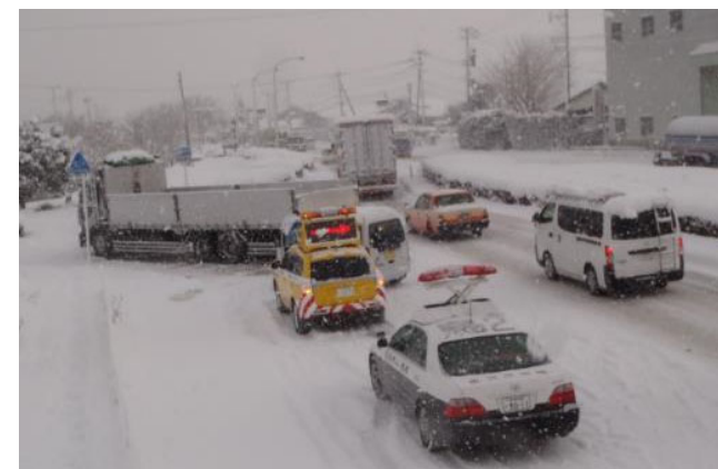
▲立ち往生車両の発生状況(鳥栖市)