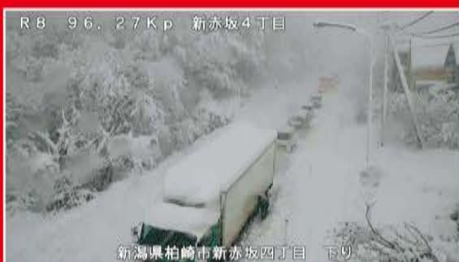
R8 96.27Kp 新赤坂4丁目