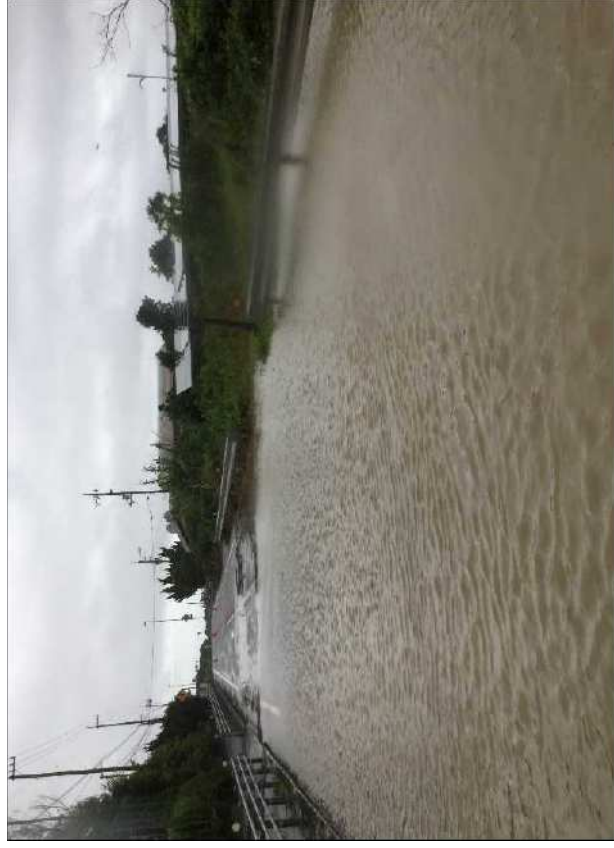
令和元年7月 冠水(国道55号 室戸市)