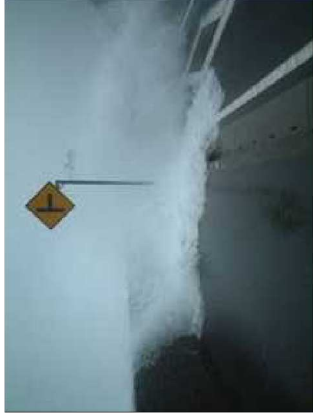
平成16年9月 越波(国道55号 室戸市)