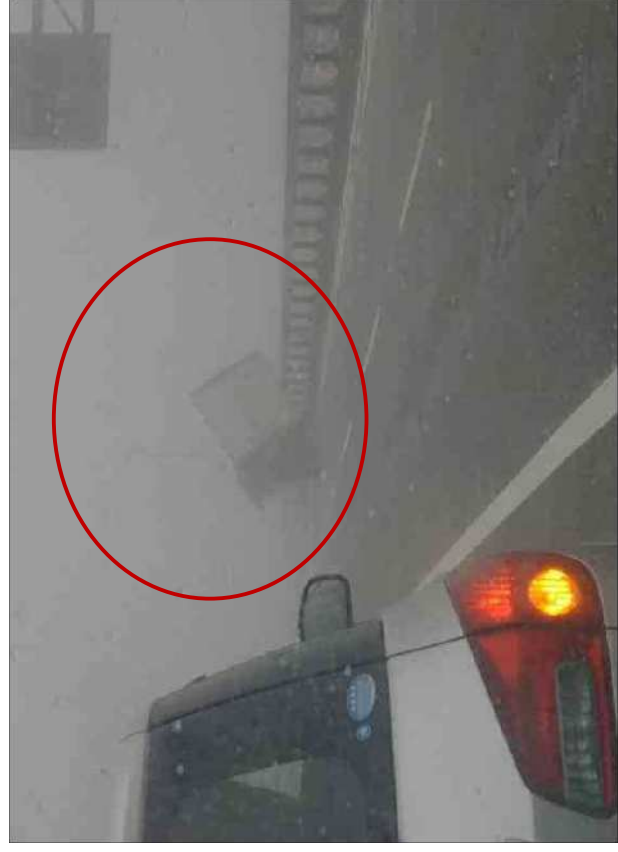
平成30年9月 トラック横転(国道55号 阿南市)