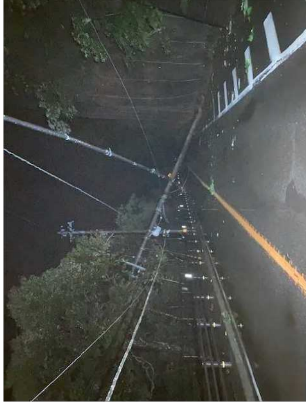
令和6年6月 電柱倒壊(国道32号 三好市)