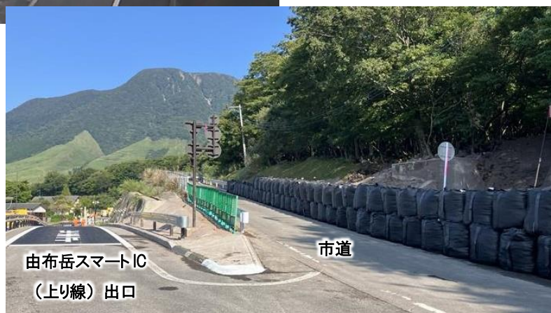
(由布岳スマートIC 上り線出口と市道の合流部)

道路区域外から本線・ランプ部に流入した土砂を撤去し、9月3日(火)17時の暫定交通開放時に設置していた上り線・走行車線上の大型土嚢は撤去し、PA園地部及び道路区域外の市道沿いに設置しました。