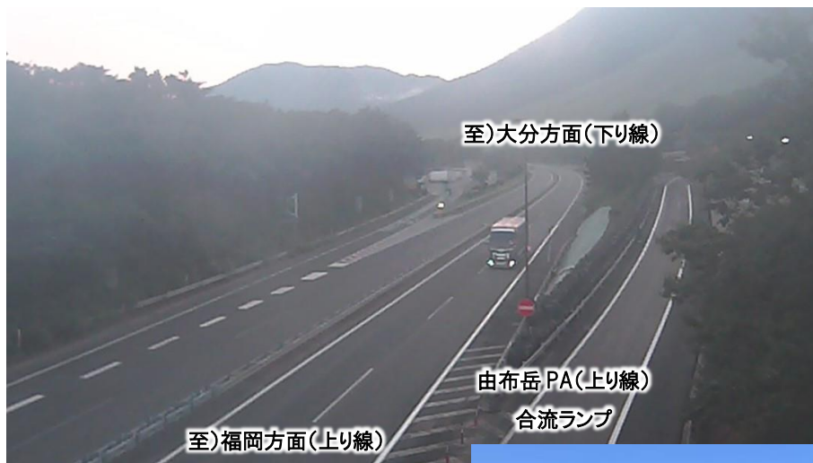
(本線上り線と由布岳 PA 上り線の合流ランプ部)