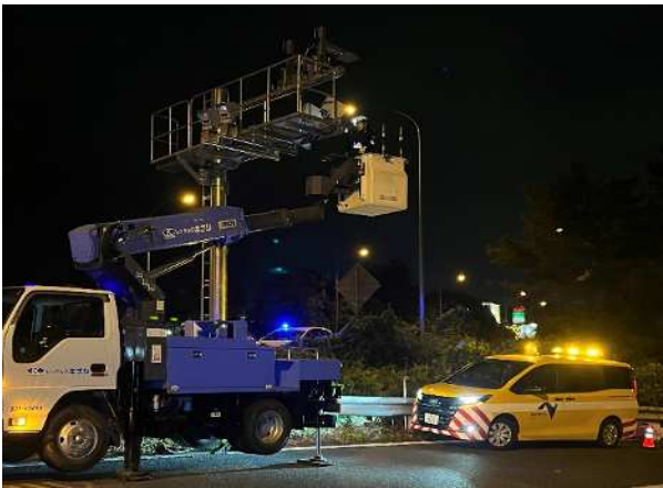
《設備点検作業状況》