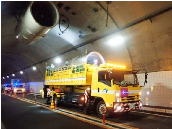
《トンネル設備更新作業状況》